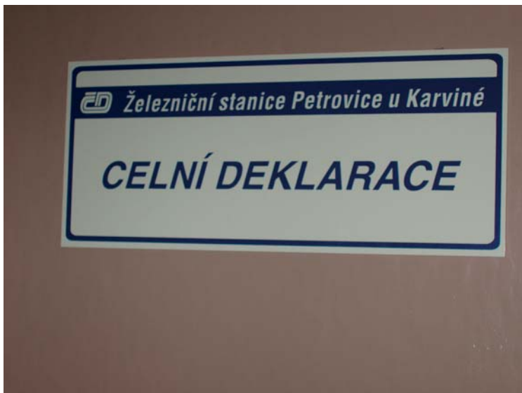
Klasický odkaz na celní služby v železničních stanicích.