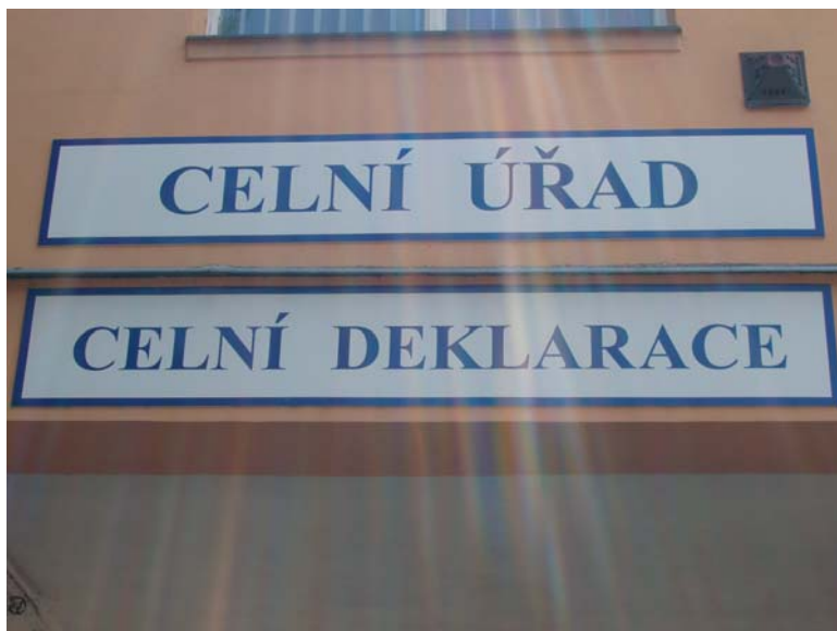
Masivními organizačními a personálními změnami prošla i Celní správa ČR.

Celní projednání po uzavření přepravní smlouvy může být na území ČR provedeno pouze na základě smluvního zajištění prostřednictvím celního zástupce ČD.